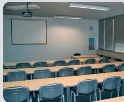
Moderně vybavené učebny pražské pobočky BIBS.