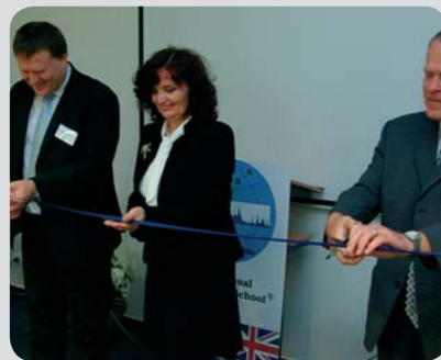
Slavnostního otevření pražské pobočky BIBS se zúčastnila i ministryně školství ČR, PhDr. M. Kopicová.