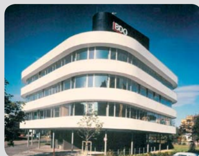
Pražská pobočka BIBS sídlí v budově auditorské společnosti BDO (metro Budějovická).