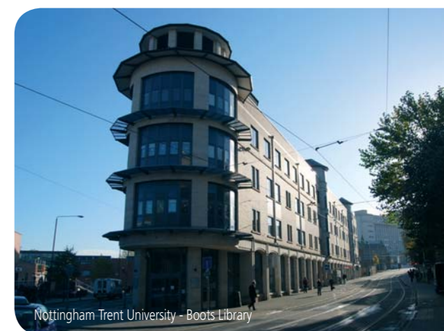
Nottingham Trent University – Boots Library

Příhlášku ke studiu naleznete ke stažení na www.bibs.cz .