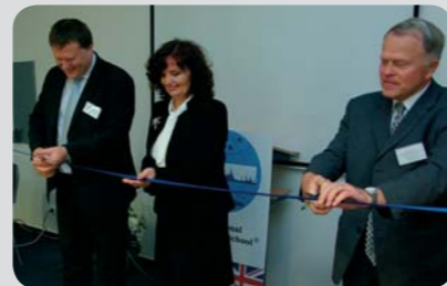
Slavnostního otevření pražské pobočky BIBS se zúčastnila i ministryně školství ČR, PhDr. M. Kopicová.