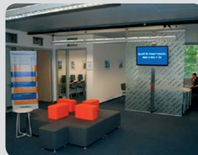
Přijemná klidová zóna pražské pobočky BIBS.