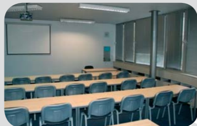
Moderně vybavené učebny pražské pobočky BIBS.