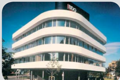
Pražská pobočka BIBS sídlí v budově auditorské společnosti BDO (metro Budějovická).