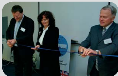
Slavnostního otevření pražské pobočky BIBS se zúčastnila i ministryně školství ČR, PhDr. M. Kopicová.