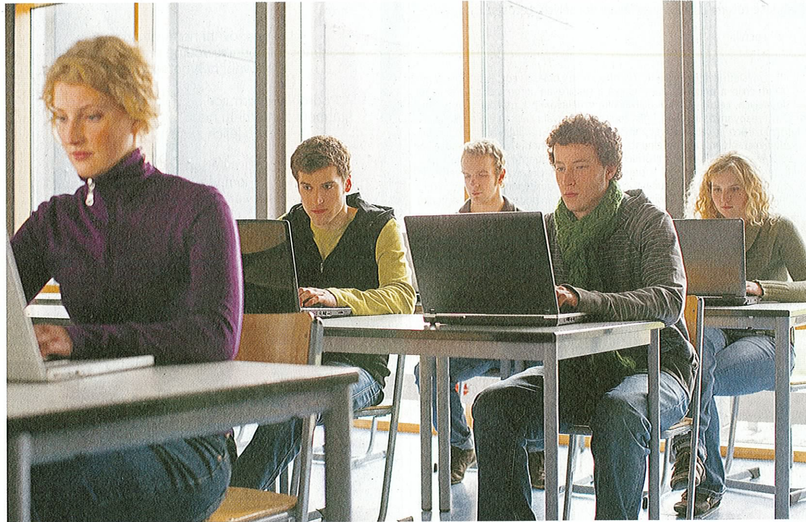
> | Pokrok. Moderní technika začíná být neodmyslitelnou pomůckou při vyučování

V Česku rapidně přibývá absolventů zahraničních vysokých škol a spolu s nimi i škála zahraničních, nejen anglo-amerických, vysokoškolských titulů, na které jsme doposud nebyli zvyklí. Například BA (HONS), LL.M, DBA, MSc a další.